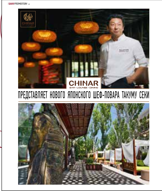
* Возможные варианты