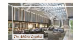
The Address Istanbul

46-этажный «Адрес Стамбул» / The Address Istanbul спроектирован всемирно известными архитекторами бюро Foster + Partners и HBA. На первых 11 этажах расположилась отель «Адрес» / The Address Hotel: 183 номера, обслуживание на высшем уровне, бассейн и спа.