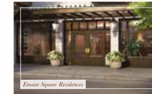
Emaar Square Residences

■ Жилье класса люкс ■ Шоппинг ■ Развлечения ■ Гастрономия ■ Отель класса люкс