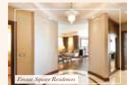
Emaar Square Residences

Жилой комплекс «Резиденция» / Residence Konutlan спроектирован так, что в нем гармонично сочетаются традиционный и элитарный образ жизни. «Резиденция» состоит из невысоких зданий в стиле традиционных районов Стамбула Нишанташи и Багдат Дималдеги.