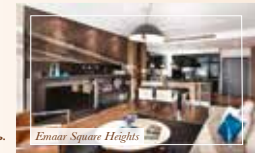
Emaar Square Heights

Квартиры «Хайтс» / Heights Konutlan спроектированы с учетом запросов динамичного городского стиля жизни. Решенный в современном стиле 33-этажный жилой комплекс «Хайтс» расположен непосредственно над торговым центром «Эмарс Сквер Молл» и предназначен для динамичных семей, молодых профессионалов и людей, живущих в режиме 24/7.