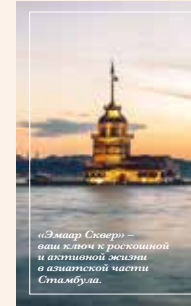
«Эмарс Сквер» – ваш ключ к роскошной и активной жизни в азиатской части Стамбула.

самый большой в мире торговый центр The Dubai Mall