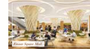
Emaar Square Mall

«Эмарс Сквер» представляет сочетание шопинга, развлечений и отдыха на самом эксклюзивном уровне. Здесь расположится торговый центр «Эмарс Сквер Молл» / Emaar Square Mall, в котором будут представлены всемирно известные торговые марки, гостиница The Address Hotel со 153 номерами, удобный офисный центр, а также собственная жилая комплекс с тремя видами квартир класса люкс, рассчитанными на превращение любого стиля жизни. Благодаря выгодному расположению и удобству проезда «Эмарс Сквер» обещает стать новым центром притяжения города.