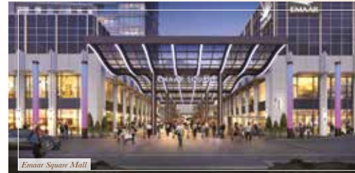
Emaar Square Mall

На закрытых и открытых площадях торгового центра к услугам посетителей будет 450 магазинов, в том числе люксовых брендов, впервые доступных в Турции. «Эмарс Сквер Молл» даст возможность удовлетворить все потребности современного горожанина: общины, развлечения и семейный отдых в атмосфере роскоши и комфорта.